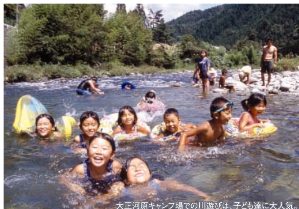
大正河原キャンプ場での川遊びは、子ども達に大人気。

「クオーレふれあいの里」のメインゾーンは「大正河原キャンプ場」。目の前を流れる清流・白川では水遊びや溪流釣り、アユ釣りが楽しめます。夏でもひんやり冷たく、どこまでも澄んだ水は感動もの。川遊びには水着や水中眼鏡をお忘れなく。小さなちびっ子達には、マスつかみが楽しめる人工河川「アクアバルコ」が安心です。また6,000㎡の広大な芝生広場「ふれあいパーク」は、のんびりくつろいだり、お弁当を広げたり、スポーツを楽しんだり遊び方自由。バターゴルフや遊びの道具などは管理棟でレンタルしてくれるのもウレシイ。キャンプ場内でバーベキューを楽しむなら、事前に予約をしておけば、食材、食器、燃料等が揃ったバーベキューセットを手配してくれるので手ぶらで出かけてもOK（一人前1,500円～）。キャンプ場から上流に少し上がった「さかなワクワク公園」では、観光ヤナで捕まえた鮎やニジマス焼いてその場で味わうこともできます。