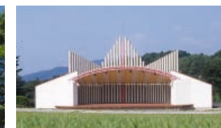
(右)高原のランドマーク、野外音楽堂「プレリウド」。白川町のシンボル・バイブルオルガンをモチーフにデザインされています。