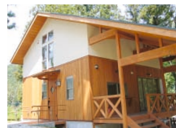
木の香りも新しい、新築タイプの10人用コテージ。

コテージ村 ヴィラ・クオーレ ☎0574・72・2462(予約は6ヶ月前の1日より受付) 🕒IN16:00～18:00 OUT11:00 👤基本料金1泊18,900円～30,000円 👤利用料金1名につき1泊1,050円(人数分必要)