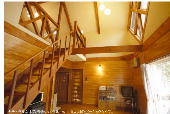
ナチュラルな木の風合いが心地いい、10人用のベーシックタイプ。