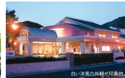
白い洋風の外観が印象的。