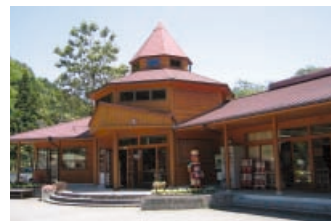
(上)受付・各種レンタルは管理棟クオーレセンターで。 (下)「アクアバルコ」でのマスのつかみ捕りは子ども達に人気。マス釣り・つかみ捕り(10匹) 1,890円