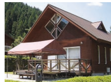
落ちついた雰囲気、10人用のベーシックタイプコテージ。