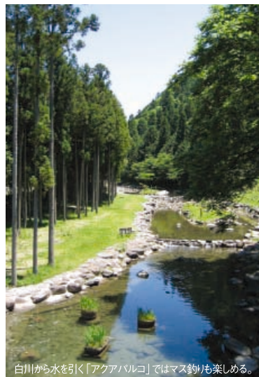
白川から水を引き「アクアバルコ」ではマス釣りも楽しめる。